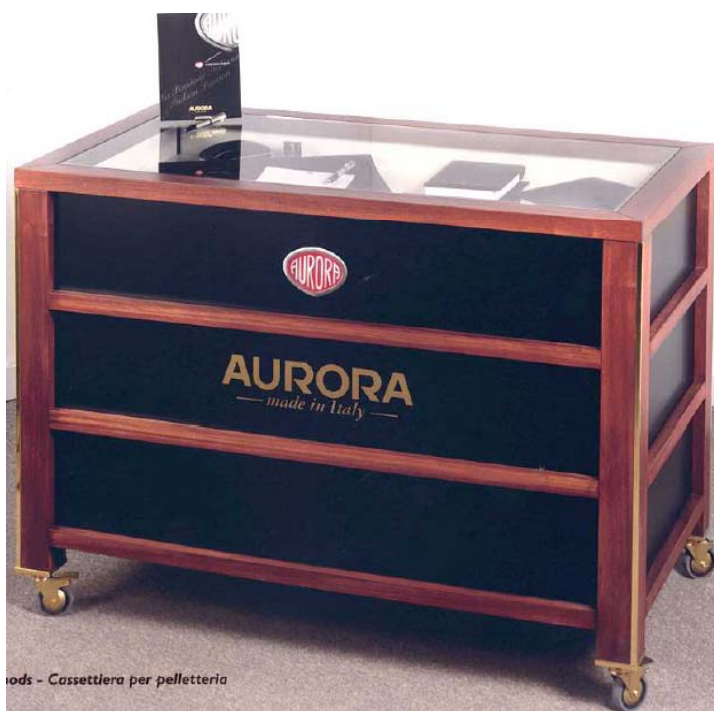
ods - Cassettiera per pelletteria